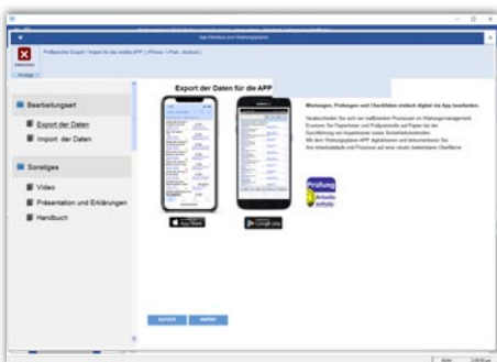
Mobile Erfassung mit dem Wartungsplaner