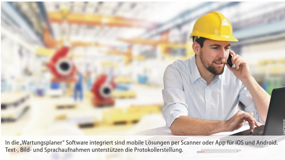
In die „Wartungsplaner“ Software integriert sind mobile Lösungen per Scanner oder App für iOS und Android. Text-, Bild- und Sprachaufnahmen unterstützen die Protokollerstellung.

Kennzahlen der Instandhaltung zur Verfügung, um den Optimierungsprozess im Betrieb voranzutreiben. Diese Übersicht macht es möglich, Schwachstellen in den Abläufen zu identifizieren und zu korrigieren, die Transparenz hilft, Arbeitsprozesse zu optimieren. Effizienteres Arbeiten sowie verbesserte Wirtschaftlichkeit der Abläufe sind wichtige Synergieeffekte. Mit diesem digitalisierten Wartungs- und Instandhaltungsmanagement wird ein zeitgemäßer und rechtskonformer Arbeitsschutz möglich, der einfach, sicher und wirtschaftlich ist.