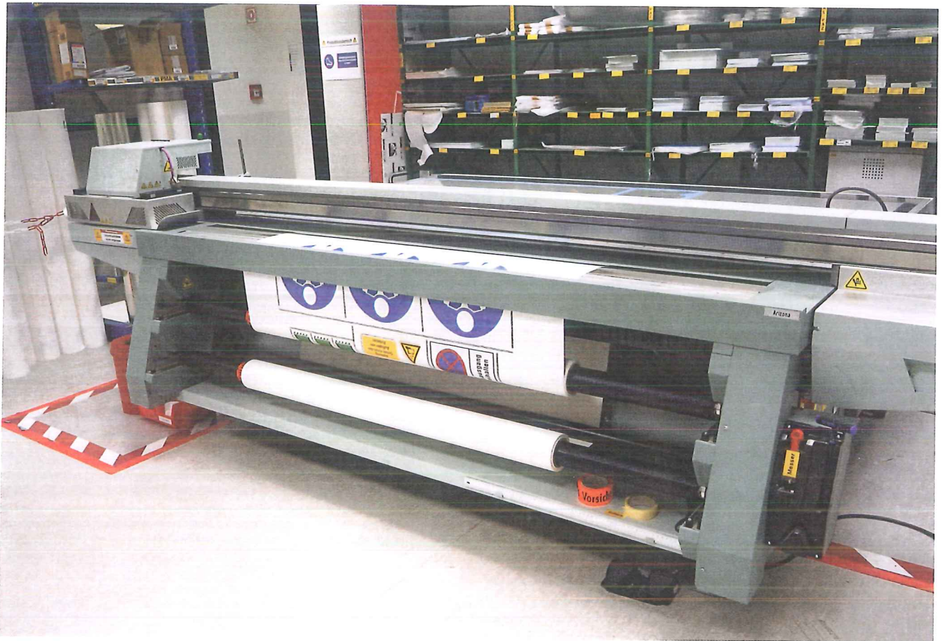
Seton produziert Produkte zur Kennzeichnung für Arbeitsschutz und Betriebssicherheit.