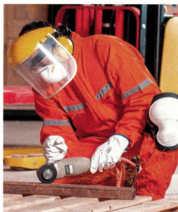
In kleinen und mittleren Unternehmen beeinflusst die Instandhaltung bis zu 40 Prozent der Kosten. Das bedeutet aber auch: Je besser sie gemanagt wird, desto größer ist die Wertschöpfung. Außerdem bedeuten funktionierende Anlagen auch eine Verbesserung des Arbeitsschutzes und der Betriebssicherheit.

Deshalb deckt auch der Wartungsplaner laut Hersteller sämtliche