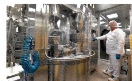
Losan Pharma setzt auf drehzahlregelte Schraubenkompressoren. Seite 28