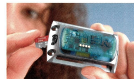
Schwingungen sind wie ein Fingerabdruck: Wie sich Schwingungsmuster, Vibrationen und Stöße erfassen lassen. Seite 22

Mit der Lösung könnten also auch Graffiti-Malereien in tiefen Zugtunneln vorgebeugt werden. Das Maschinen-Netz ist eine optimierte LTE-Variante. Batterielauferzeiten der Sensoren von bis zu zehn Jahren ermöglichen es, die Systeme ohne externe Stromversorgung zu betreiben. www.vodafone-deutschland.de