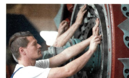
Schnelle Revisionen von Ventilatoren bis 30 Tonnen. Seite 31