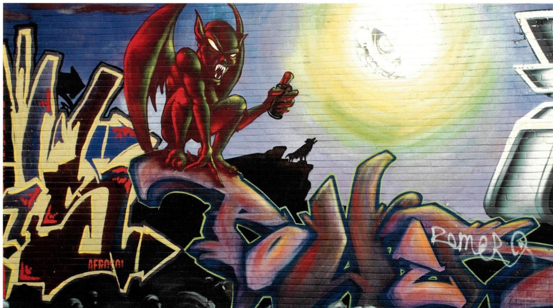
Automatischer Graffiti-Alarm über das Maschinen-Netz von Vodafone: Ein Sensor ertappt illegale Sprayer auf frischer Tat und beugt so dem Vandalismus vor.